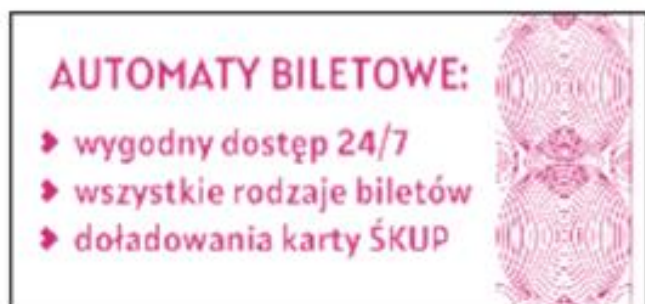
Rewers z przykładową reklamą