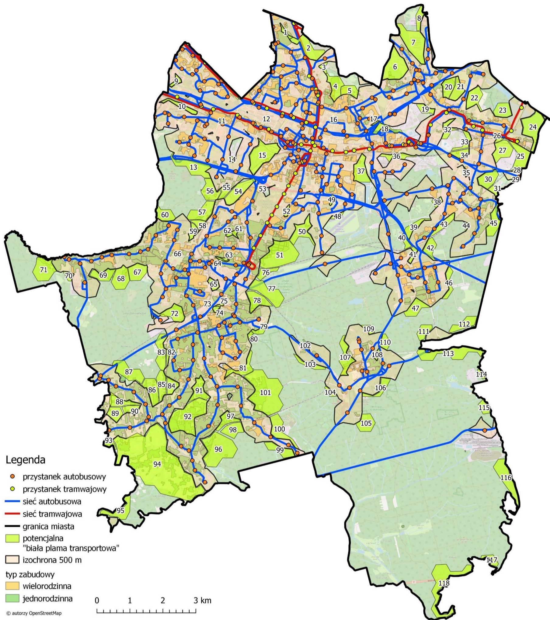
Rys.1. Mapa z zaznaczonymi 118 obszarami zamieszkałymi, które znajdują się poza zasięgiem izochrony dojścia do przystanków (dla układu drogowo-ulicznego) o wartości 500 metrów.